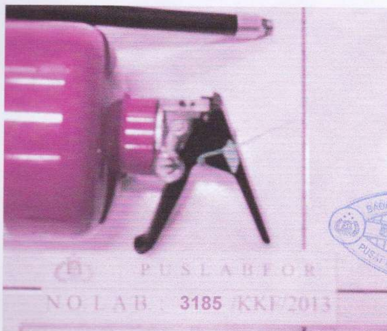
Foto no. 2. : Sampel pemadam diperlihatkan segel pengaman dan pengukur