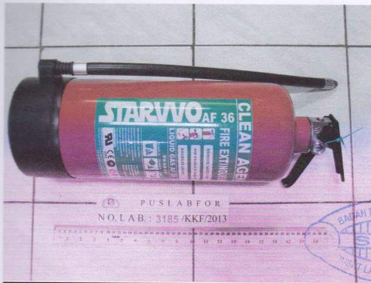
Foto no. 1. : Sampel yang diterima berupa 1 (satu) buah pemadam kebakaran Merk Starvvo AF 36 ukuran 6 (enam) kg. -----